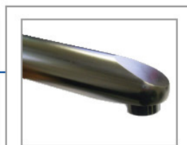
■ Bec inox 316L électropoli