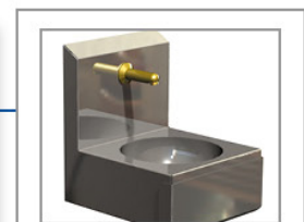
Commande à bandeau fémoral