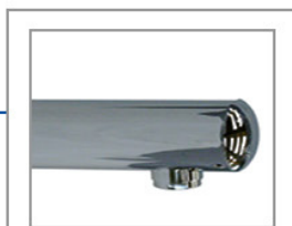
■ Commande électronique à pile