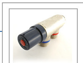
■ Robinet mélangeur thermostatique