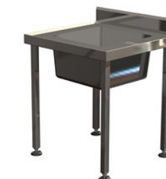
1 bac 700 x 700 mm