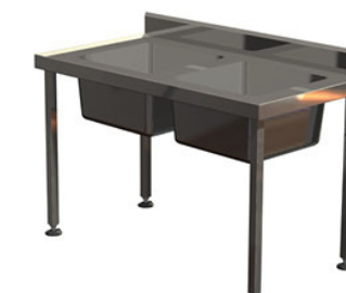
2 bacs 1200 x 700 mm