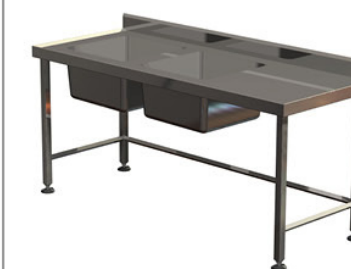
2 bacs 1 égouttoir 1800 x 700 mm