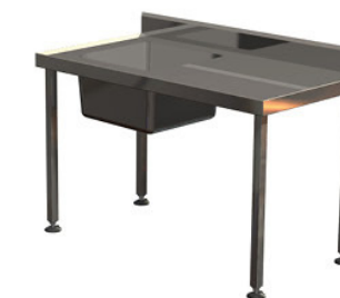
1 bac 1 égouttoir 1200 x 700 mm